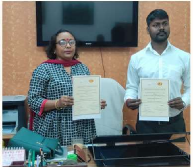
26 MARCH MOU SIGNED WITH MUNICIPAL CORPORATION, BAREILLY.