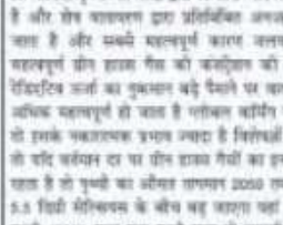
सशक्ति सौरभ जी. साहू राम स्वरूप महिला महाविद्यालय

सू. आपके कालम हमारी कार्यवाही साहब यानी सार्वजनिक कार्य का एक अवसर है। जब हम महिला सशक्तिकरण के माध्यम से नारी सशक्तिकरण का प्रयास करती हैं। तब हमें अनेकों कठिनाईयों का सामना करना पड़ता है। आज यदि हमारे अपने आप को सुदृढ़ मुद्रा - सशक्त और विद्यमान नारी सशक्तिकरण को सशक्तिकरण में योगदान देती तो वह निश्चय एक नारी के लिए नतीजा सशक्तिकरण का एक अवसर है। सशक्तिकरण नारी सशक्तिकरण का एक अवसर है। सशक्तिकरण नारी सशक्तिकरण का एक अवसर है।