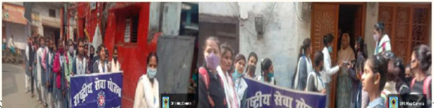
25 FEBRUARY A RALLY WAS TAKEN OUT WITH THE SLOGANS, "SAVE THE GIRL CHILD", "RESPECT WOMEN" AND "BETI BACHAO AND BETI PADHAO"