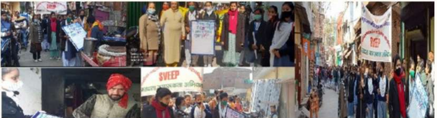
12 FEBRUARY UNDER THE ONE- DAY NSS CAMP, A VOTER AWARENESS RALLY WAS TAKEN OUT. AN OATH FOR THE SAME WAS ADMINISTERED TO EVERYONE THROUGH A SIGNATURE CAMPAIGN.