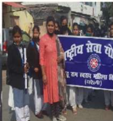
22 FEBRUARY UNDER THE SEVEN-DAY SPECIAL CAMP OF NSS, A CLEANLINESS CAMPAIGN WAS LAUNCHED AND A RALLY WAS TAKEN OUT TO ENCOURAGE THE SAME.