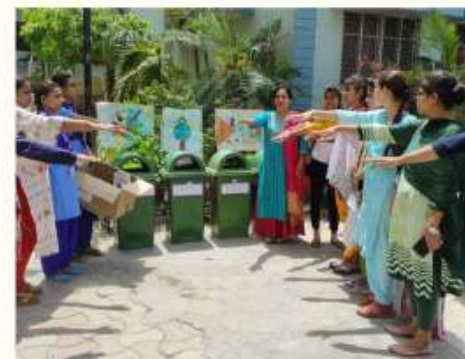
2 APRIL EARTH DAY WAS CELEBRATED BY DOING WASTE SEGREGATION