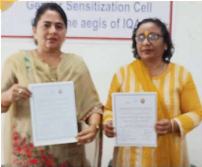
24 MARCH MOU SIGNED WITH GOKULDAS HINDU GIRLS COLLEGE, MORADABAD