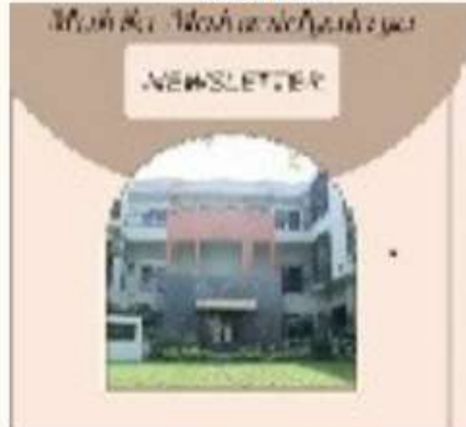
11 MARCH THE COLLEGE NEWSLETTER WAS INAUGURATED. ON THE SAME DAY, A GRAND FASHION SHOW WAS ALSO ORGANISED BY THE FASHION DESIGNING DEPARTMENT AND DRAWING AND PAINTING DEPARTMENT.