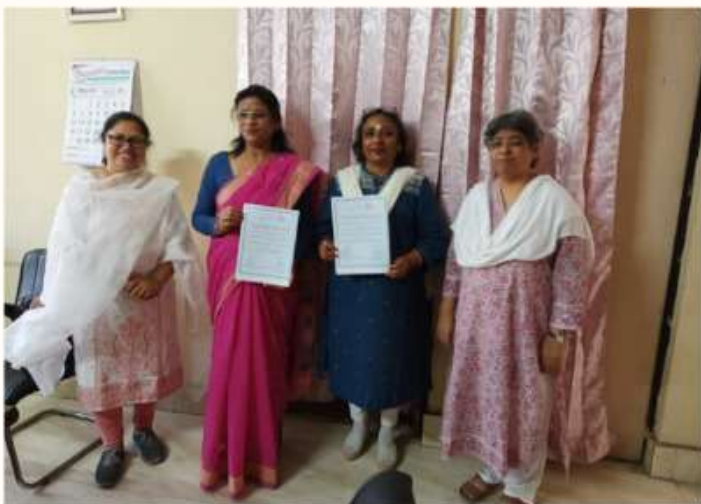
25 MARCH MOU SIGNED WITH V.R AVANTIBAI LODHI COLLEGE, BAREILLY.