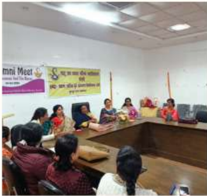
24 FEBRUARY AN ALUMNI MEET WAS ORGANIZED BY THE COLLEGE ALUMNI COMMITTEE ON THE THEME "DREAMERS AND DOERS."