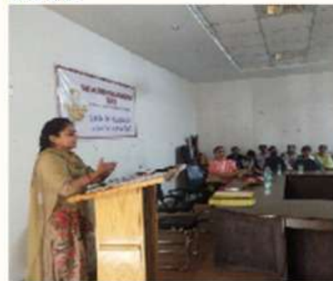
24 MARCH A GUEST LECTURE WAS ORGANISED BY THE GENDER SENSITIZATION CELL OF THE COLLEGE ON THE TOPIC "GENDER SENSITIZATION IN NEP 2020".