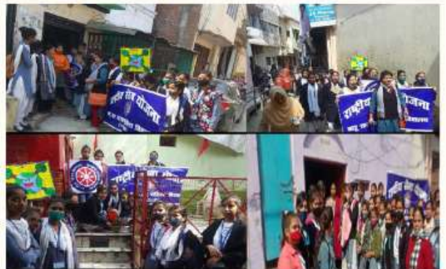
23 FEBRUARY ON THE SECOND DAY OF SEVEN-DAY SPECIAL NSS CAMP, A RALLY ON ENVIRONMENTAL AWARENESS WAS TAKEN OUT, GIVING THE MESSAGE OF PLANTING MORE TREES IN A BID TO COUNTER POLLUTION.