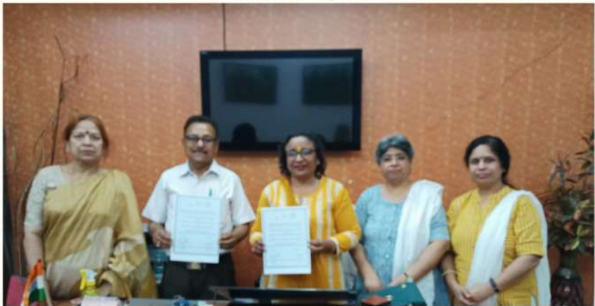
24 MARCH MOU SIGNED WITH GANGASHEEL MAHAVIDYALAYA, NAWABGANJ, BAREILLY.