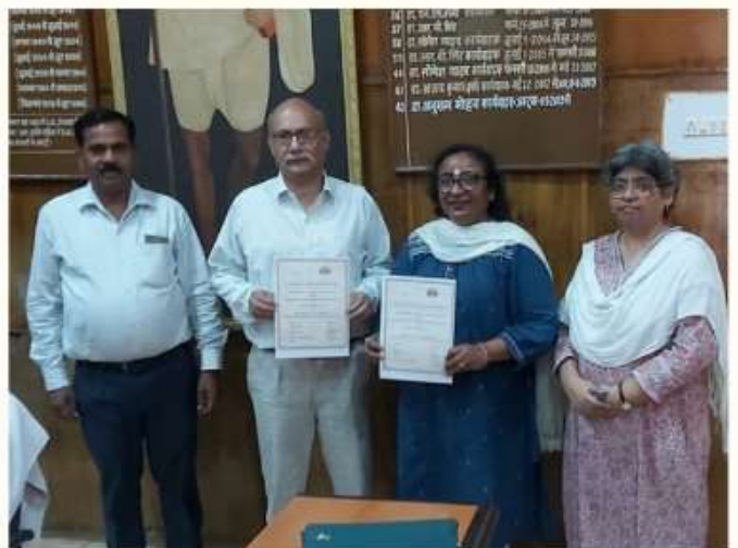
25 MARCH MOU SIGNED WITH BAREILLY COLLEGE.