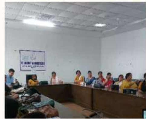
31 MARCH A WORKSHOP WAS ORGANISED ON ACADEMIC AUDIT BY THE IQAC.