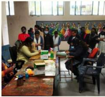
8 FEBRUARY COVID- 19 VACCINATION CAMP WAS ORGANISED IN THE COLLEGE.