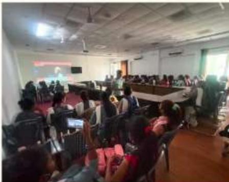
1 APRIL "PARIKSHA KI BAAT, PM KE SAATH" WAS LIVESTREAMED FOR THE STUDENTS IN THE COLLEGE.