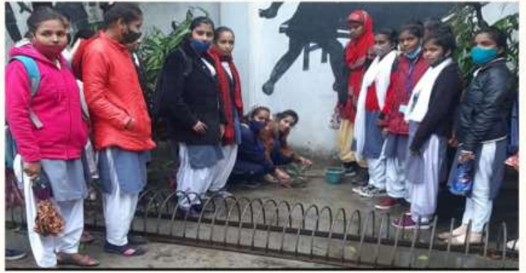
9 FEBRUARY A TREE PLANTATION DRIVE WAS ORGANISED BY THE VOLUNTEERS FROM COLLEGE TO GIVE THE MESSAGE OF ENVIRONMENTAL AWARENESS THROUGH SLOGANS AND POEMS ON THE TOPIC "ENVIRONMENTAL PROTECTION".