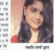
सशक्ति सौरभ जी. साहू राम स्वरूप महिला महाविद्यालय

सू. आपके कालम हमारी कार्यवाही साहब यानी सार्वजनिक कार्य का एक अवसर है। जब हम महिला सशक्तिकरण के माध्यम से नारी सशक्तिकरण का प्रयास करती हैं। तब हमें अनेकों कठिनाईयों का सामना करना पड़ता है। आज यदि हमारे अपने आप को सुदृढ़ मुद्रा - सशक्त और विद्यमान नारी सशक्तिकरण को सशक्तिकरण में योगदान देती तो वह निश्चय एक नारी के लिए नतीजा सशक्तिकरण का एक अवसर है। सशक्तिकरण नारी सशक्तिकरण का एक अवसर है। सशक्तिकरण नारी सशक्तिकरण का एक अवसर है।