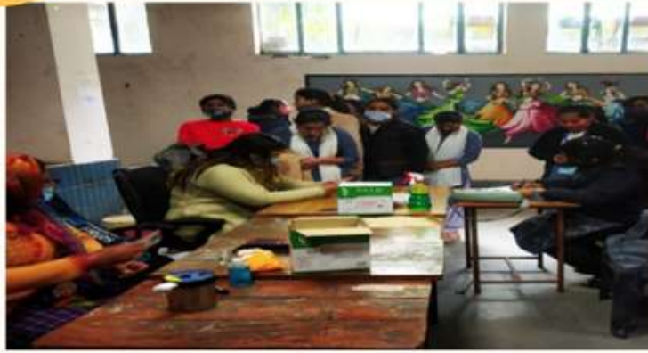
8 FEBRUARY UNDER THE ONE- DAY NSS CAMP, A SLOGAN- WRITING COMPETITION WAS ORGANISED ON THE TOPIC- "VOTER AWARENESS".