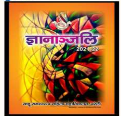
22 FEBRUARY THE COLLEGE ANNUAL MAGAZINE AND ITS E-VERSION-"GYANANJALI" WAS RELEASED.