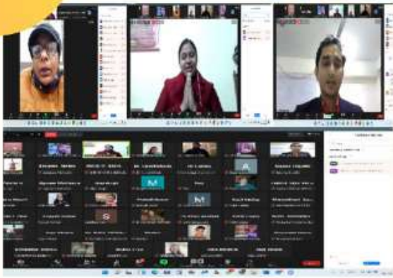
3 FEBRUARY AN ONLINE WORKSHOP ON VARIANTS OF COVID 19 WAS ORGANISED.